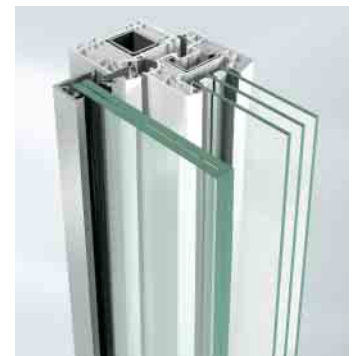
Befestigung mit Falzleiste

Stangenvariante Durchmesser von 12 bis 35 mm