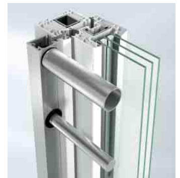
Befestigung mit Falzleiste