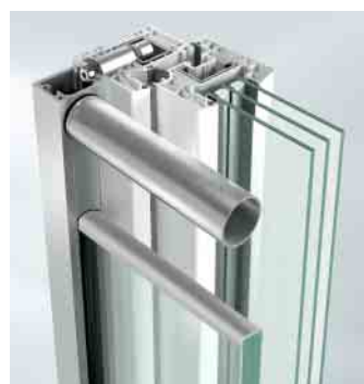
Befestigung mit Profildübel