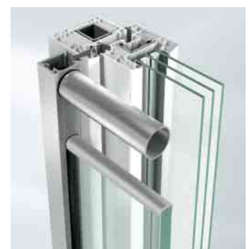
Befestigung mit Falzleiste